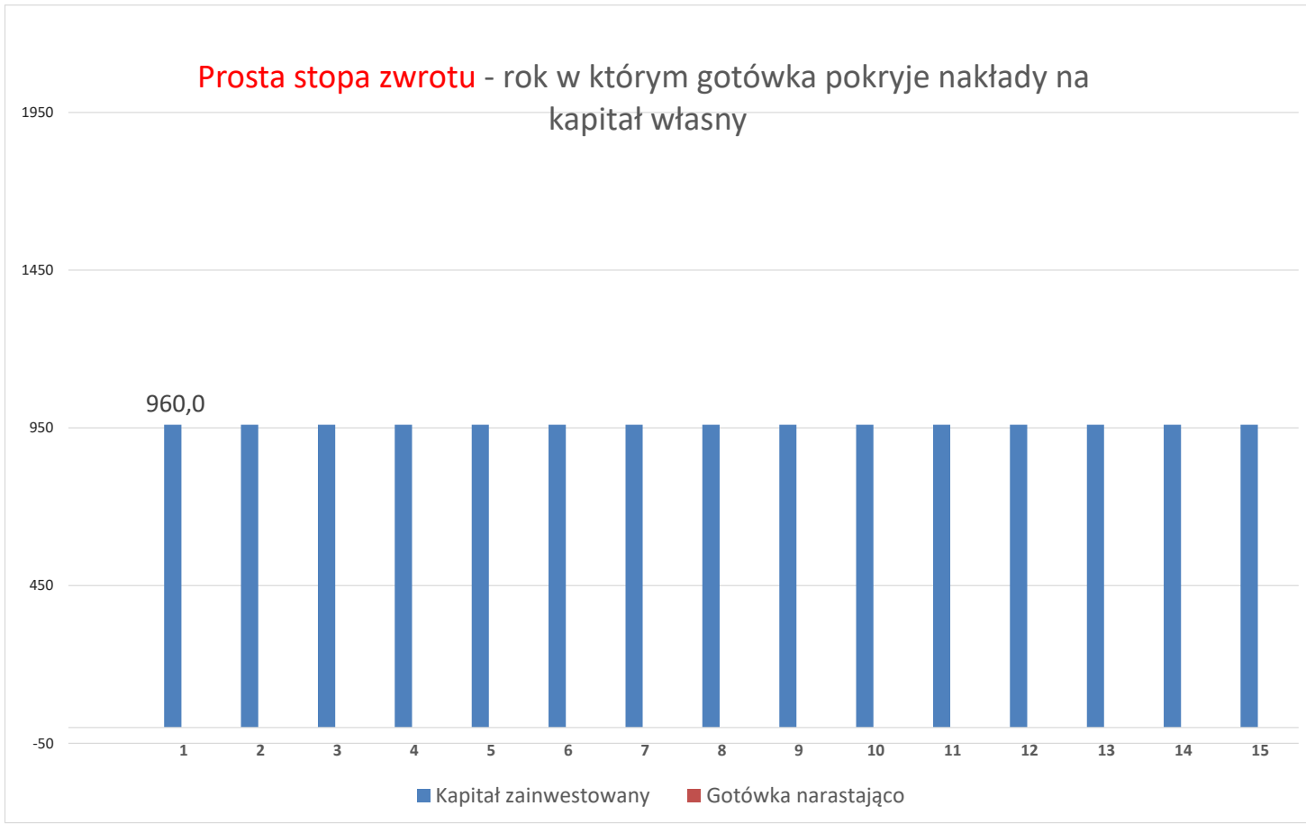
Tabela Nr - 23 - Prosta stopa zwrotu w latach